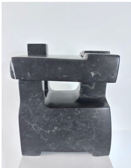
Petit temple , 1989, Marbre St-Triphon, 31 x 24 x 18 cm, Unique @ Albert Rouiller