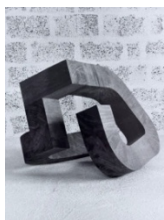
Caligraphie , 1992 Teck 90 x 110 x 100 cm Unique @Albert Rouiller

Au cœur de sa démarche sculpturale réside un dialogue exigeant avec les matériaux. Marbre, bronze, bois ou aluminium deviennent les vecteurs d'une exploration formelle où la masse semble animée d'une tension interne. Ses sculptures, d'apparence abstraite, conservent une dimension organique, presque vivante, comme si la matière était en perpétuelle mutation.