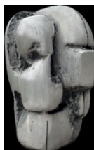
Sans titre , 1962 Aluminium 78 x 55 x 50 cm Unique @Albert Rouiller

Les dessins, loin d'être de simples études préparatoires, constituent un prolongement essentiel de cette recherche. À partir d'un trait à l'encre de Chine, altéré par projections d'eau, l'artiste fait émerger des formes en suspension, qu'il vient ensuite révéler par la couleur. Le volume y affleure subtilement, dans un équilibre délicat entre maîtrise du geste et part d'aléatoire.