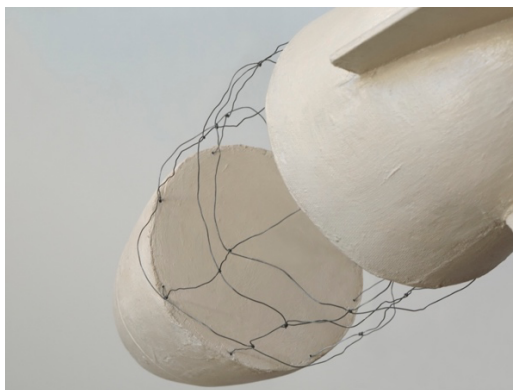
Léviathan (détail) , 2025, Installation, 80 x 297 cm, © Antoine Martin

Quel rôle joue-t-il dans l'œuvre d'Antoine Martin ? Force sombre et menaçante ou rempart contre le chaos du monde ? À chacun d'y voir sa propre résonance.